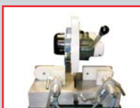
POSICIÓN DE DESCANSO PARA CORTE A 90° VERTICAL.