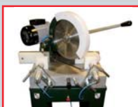
POSICIÓN DE DESCANSO PARA CORTE A 45° CON GIRO HACIA LA DERECHA.