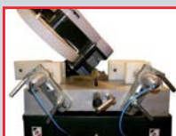
POSICIÓN DE DESCANSO PARA CORTE A 45° CON VUELCO HACIA LA IZQUIERDA.