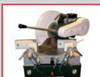
POSICIÓN DE DESCANSO PARA CORTE A 45° CON GIRO HACIA LA IZQUIERDA.